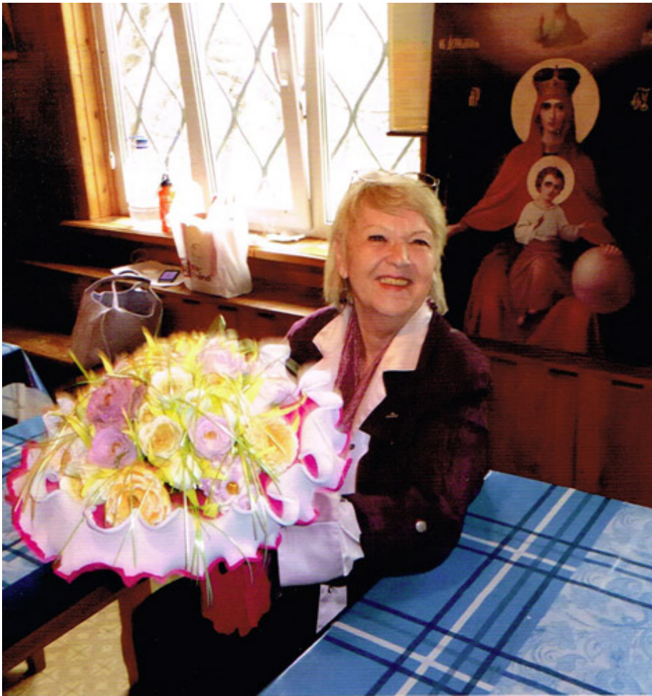
Zurück zu Fragen und Antworten zur Schicksalsanalyse in Moskau 2019